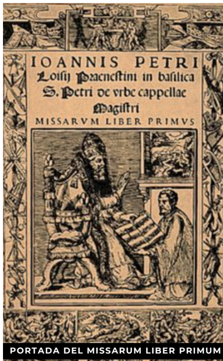
PORTADA DEL MISSARVM LIBER PRIMVS