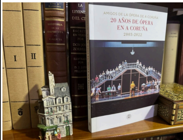
El libro 20 años de ópera en A Coruña (2003-2022).

En sus 207 páginas, la publicación refleja los últimos veinte años de actividad operística en A Coruña, periodo en el que se han presentado más de cincuenta títulos de ópera.