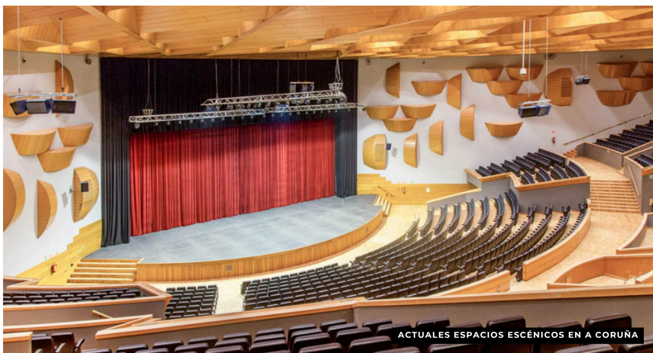
ACTUALES ESPACIOS ESCÉNICOS EN A CORUÑA