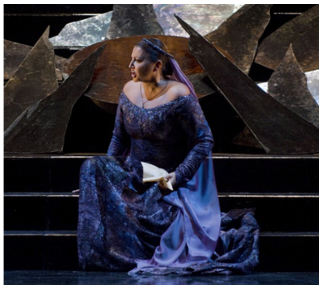
Il trovatore, Aida, La Traviata, Macbeth