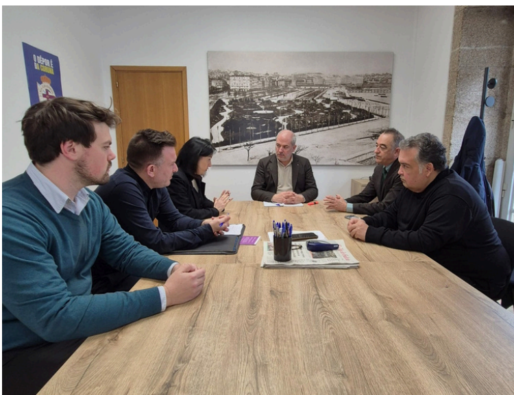
Encuentro en la Concejalía de Cultura de A Coruña con los representantes de este área y el de turismo para avanzar en los fórmulas conjuntos de proyección de la Temporada Lírica programada por Amigos de la Ópera de A Coruña.

Un encuentro en el que se han cerrado algunos de los puntos clave de la 74 Temporada Lírica en los que tanto las áreas de Cultura como Turismo tienen un peso especial ya que la temporada trasciende las propias representaciones para implicar a la ciudad en toda su dimensión (colegios, hospitales, museos...). La Asociación de Ópera más antigua de España es un referente que reúne a artistas, técnicos y público procedente de toda la geografía gallega, nacional e internacional.