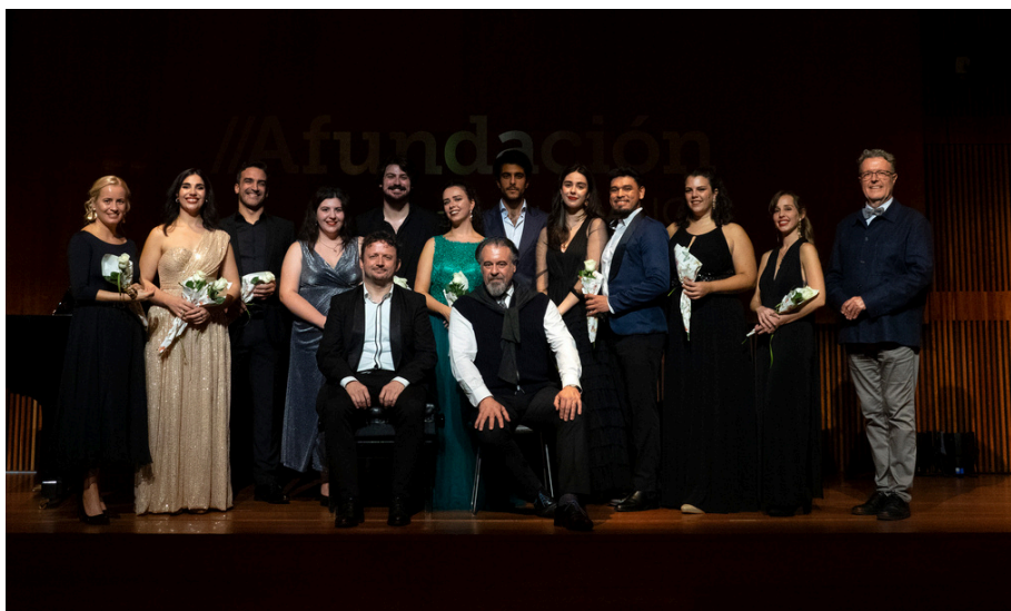
Imágenes del curso de interpretación vocal en las ediciones 2024 y 2025.

Los y las interesadas que deseen asistir como oyentes deben remitir su solicitud a cursos@amigosoperacoruna.org con la ficha inscripción cubierta, una copia del DNI por ambas caras, y el justificante de la